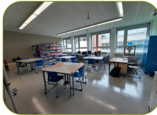
FEG, Raum A002

Am FEG wurden zwei Räume zu Lernwerkstätten umgebaut. Beide Räume haben 3 Computer mit WLAN, Regale mit frei zugänglichen Arbeitsmaterialien und Schränke mit Workshopkisten, die nach Bedarf zur Verfügung gestellt werden.