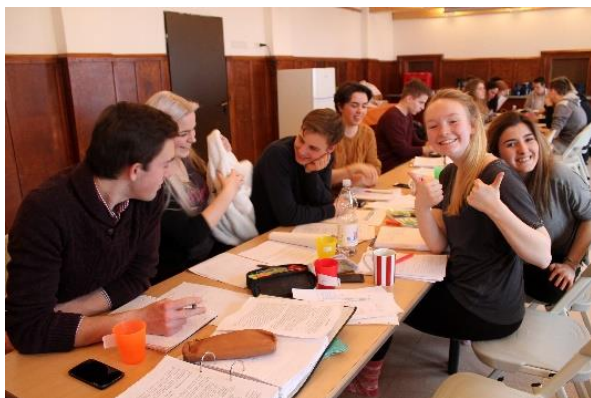
IB Schüler auf einem Arbeitswochenende